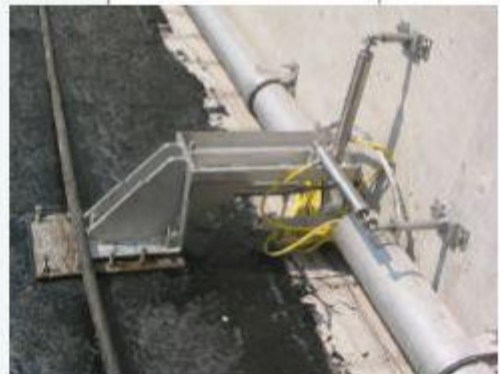
Se encuentran disponibles Fisurómetros especiales para aplicaciones específicas.