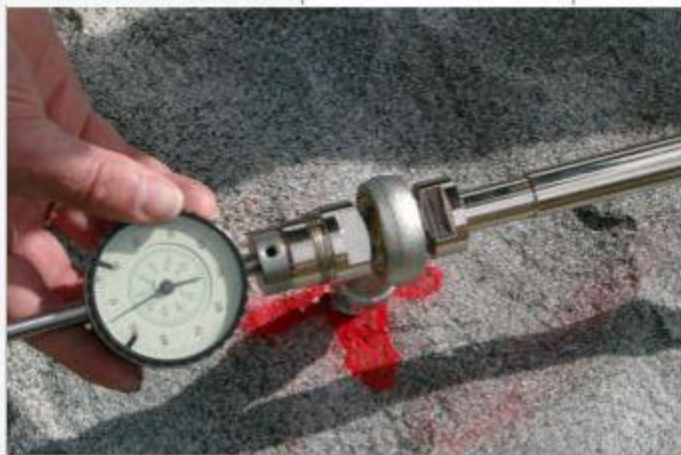
Lecturas realizadas por medio de un micrómetro

La adquisición de datos es la misma que se usa en el caso de los extensómetros de varilla. El micrómetro y transductor de desplazamiento puede utilizarse para ambos instrumentos, extensómetro y fisurómetro. Debido a esta compatibilidad de instrumental, es posible la integración en nuestro sistema automático de adquisición de datos DAMOS, sin necesidad de adaptaciones adicionales.